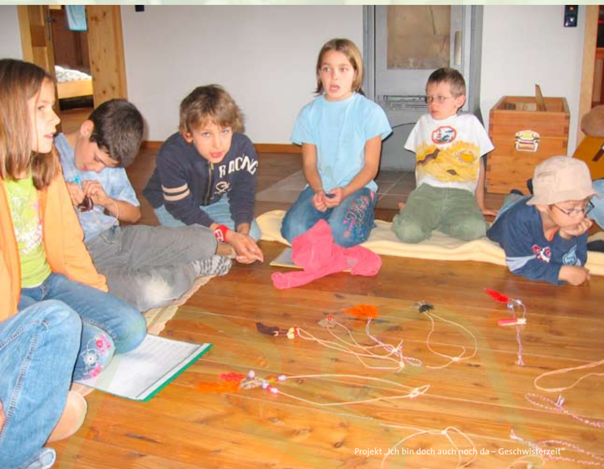
Projekt „Ich bin doch auch noch da – Geschwisterzeit“